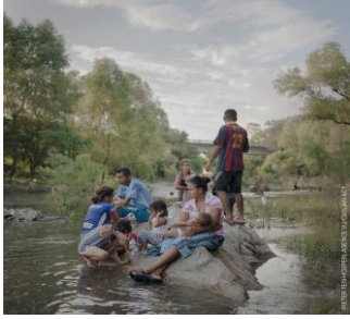
2. De serie foto's die Pieter ten Hoopen gemaakt heeft in Zuid-Amerika (kleurenfoto's, onder de snuit van de dolfijn)