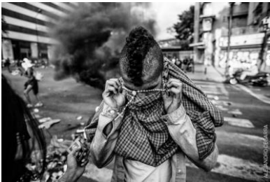
4. De serie foto's die Alejandro Cegarra maakte in Venezuela (zwart-witfoto's, dicht bij de draaideur in de hal)

5A Welke serie heb je gekozen (noteer de naam van de fotograaf)