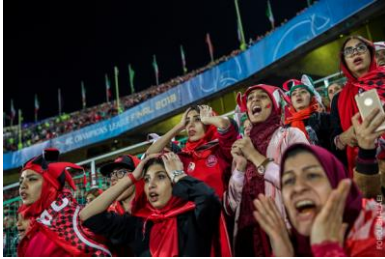
3. De serie foto's die Forough Alei gemaakt heeft in Iran (kleurenfoto's, dicht bij grote ramen richting pleintje Coffeelovers)